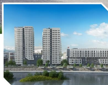
ATAL Towers II, Wrocław