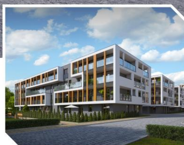
Wielicka Garden, Kraków