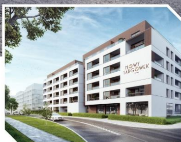
Nowy Targówek, Warszawa