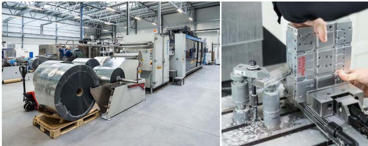
Na zdjęciu: Linia do termoformowania spółki KGL S.A.

opakowaniowego o założenia GOZ, a w szczególności maksymalizację użycia surowców pochodzących z recyklingu w procesach produkcji folii i opakowań oraz ich zdolności do pełnego recyklingu.